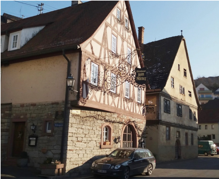
Doppelt gut - neues Weinhaus & alte Mühle