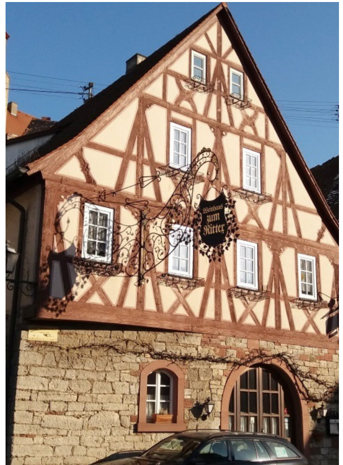
Das Weinhaus „Zum Ritter“