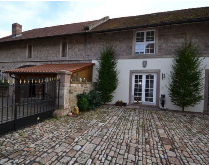
Reihenhaus im Ökonomiebau