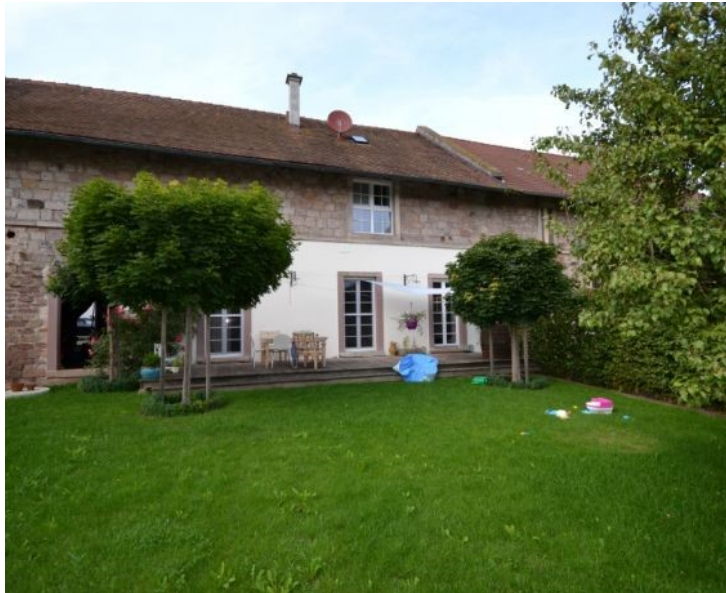
Historisches Reihenhaus mit Garten