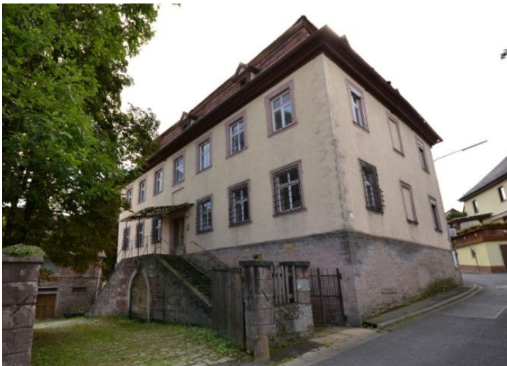
Anwesen mit historischer Bedeutung