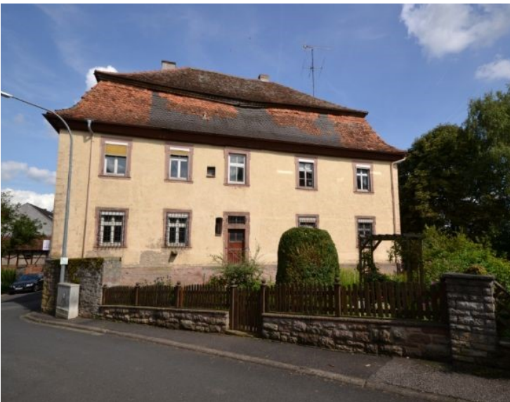
Reizendes Barockschloss des 18. Jh.