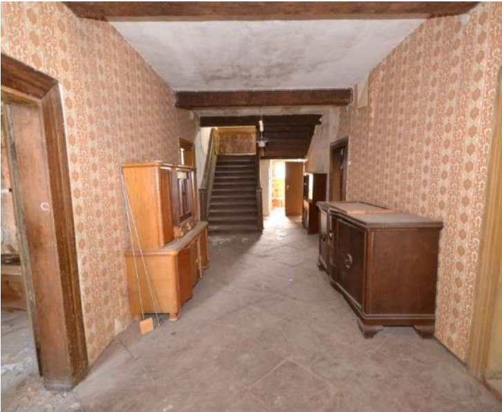
Groß angelegter Eingangsbereich