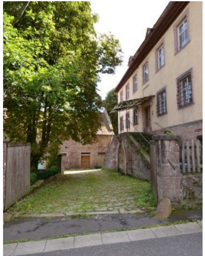
Zufahrt zum Schlosshof