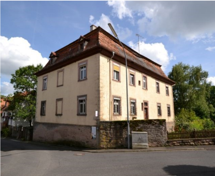
Das „Hofhaus“ von Völkerleier