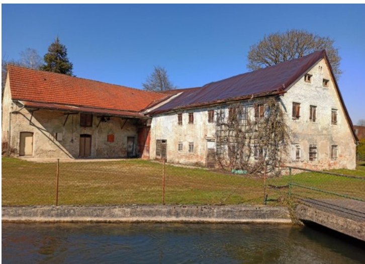
© (E.d.A.) Beeindruckende Hofstelle in Bachnähe