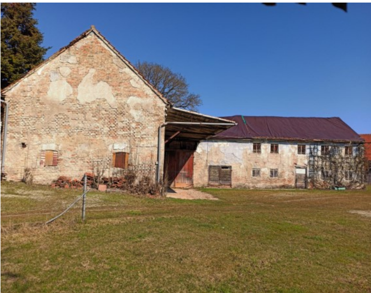
Attraktive Hofanlage des 19. Jahrhunderts