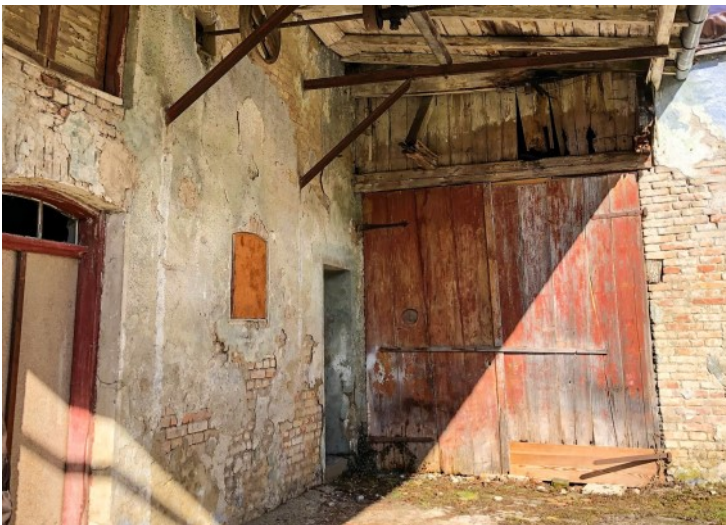
Zugang zur historischen Scheune