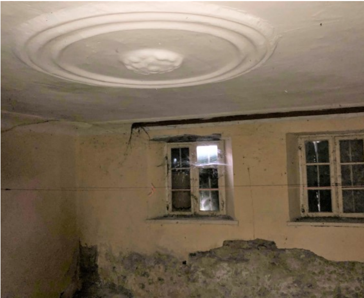
Historische Stube mit Stuckdecke