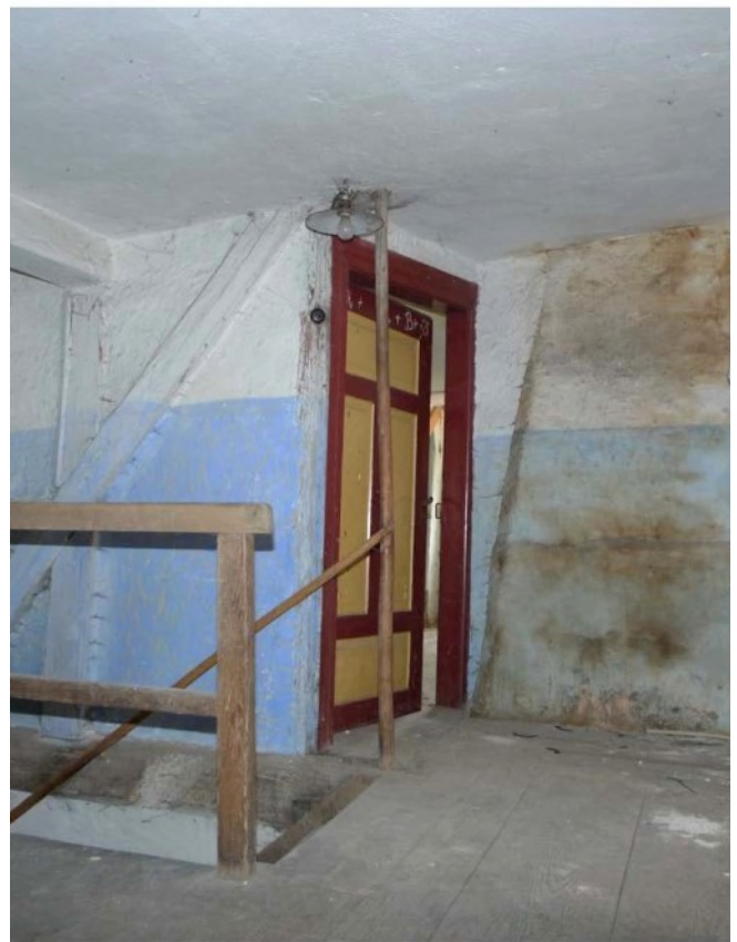
Treppenaufgang ins DG