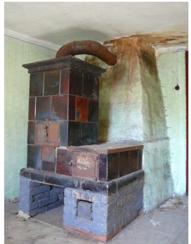
Sesselofen von „anno dazumal“