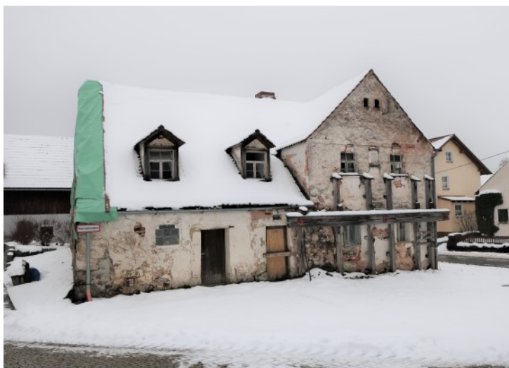
Wohnstallhaus mit mächtigem Zwerchhaus