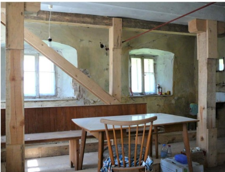
Wohnraum im EG