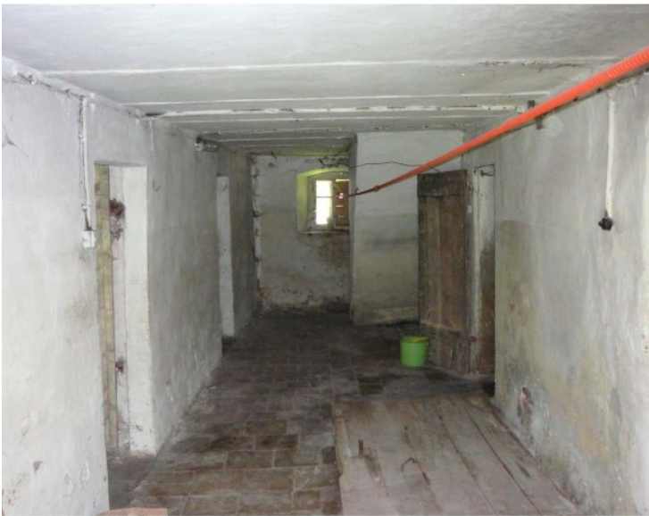
© (M. Beck) Flurbereich im EG