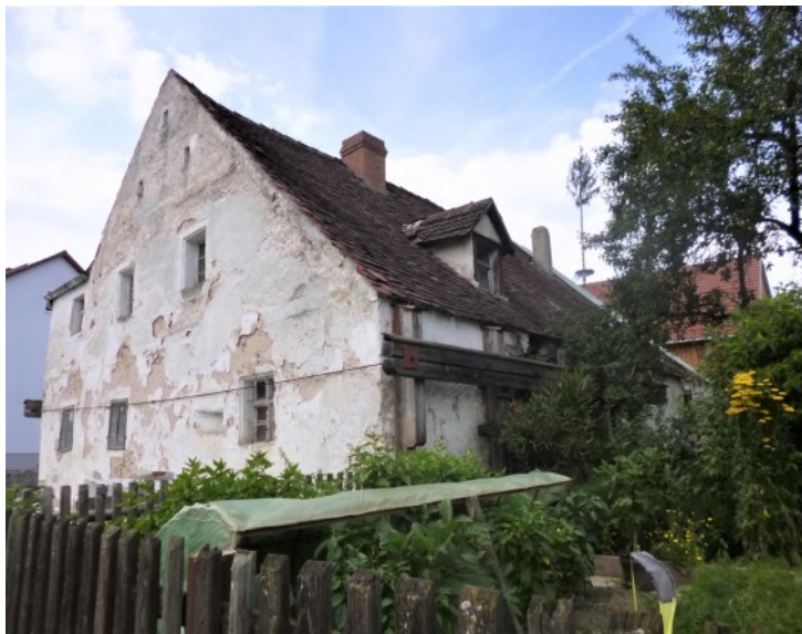
Historisches Bauernhaus mit Garten