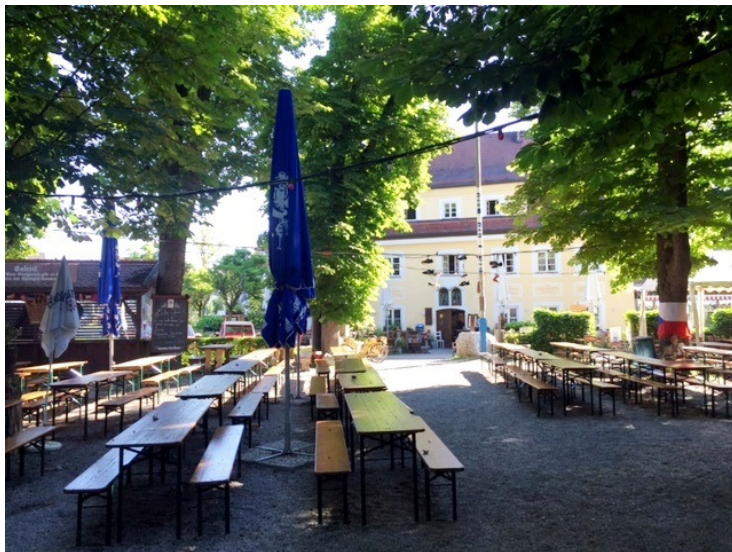
Original bayerischer Biergarten