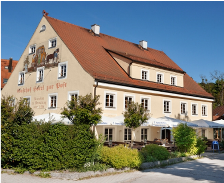
Der Gasthof zur Post