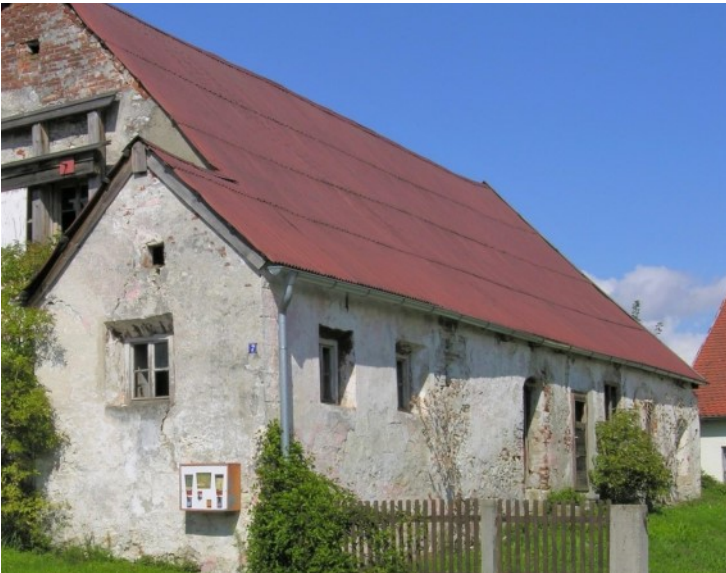
Traditionelles Wohnstallhaus des 17. Jh.