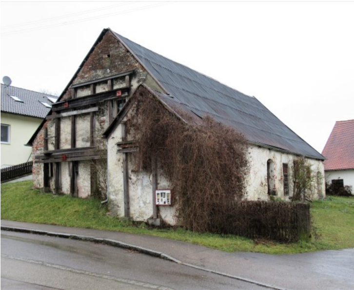
Historisches Amtshaus in Donaunähe