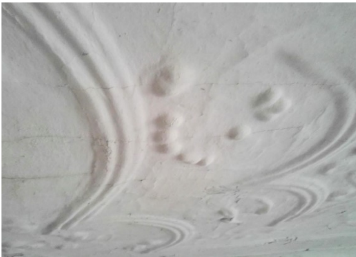
Stuckdecke in der ehemaligen Amtsstube