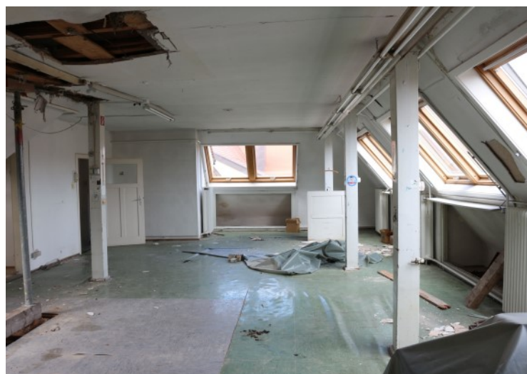
Attraktiver Wohnraum von beeindruckender Größe