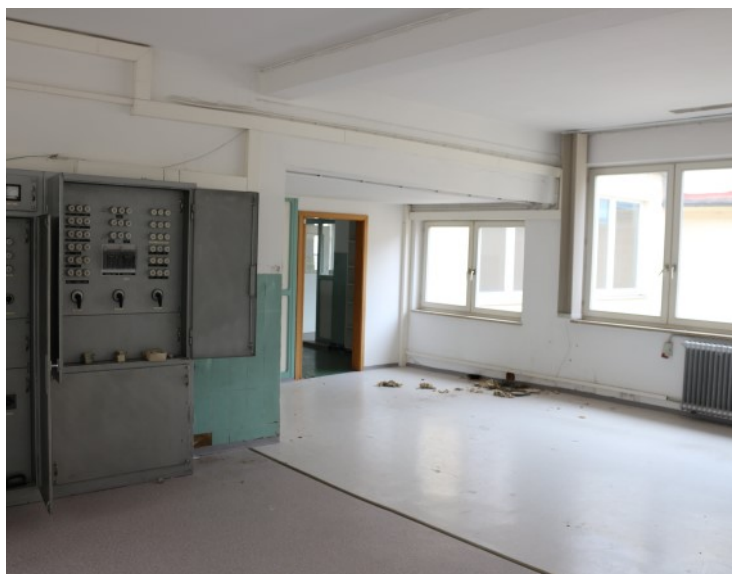
Vielseitig nutzbare Räumlichkeiten