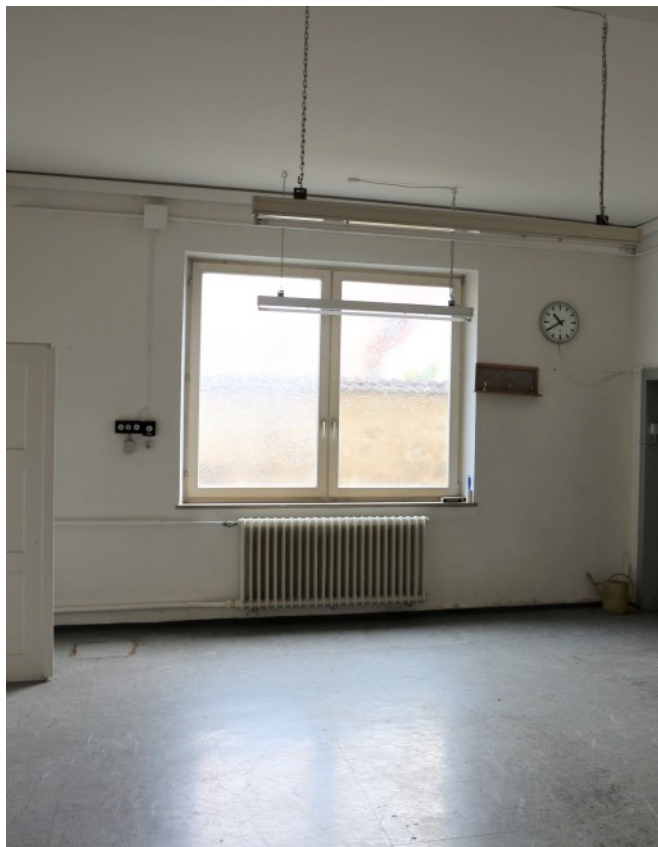
Vielseitig nutzbare Räume