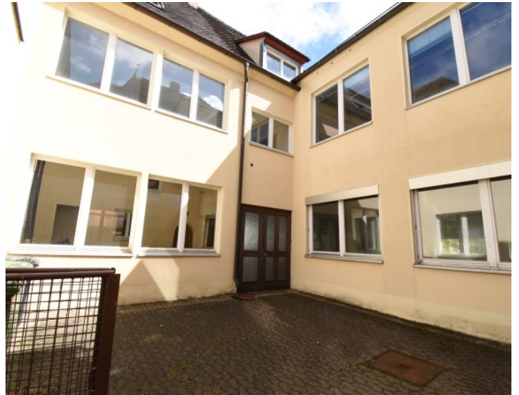
Zugang vom kleinen Hofraum