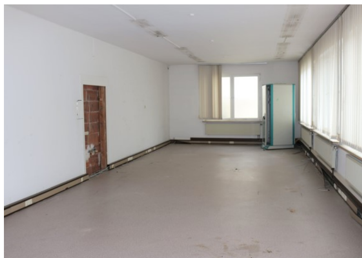
Ehemalige Räume zur Text-, Foto- und Anzeigenmontage