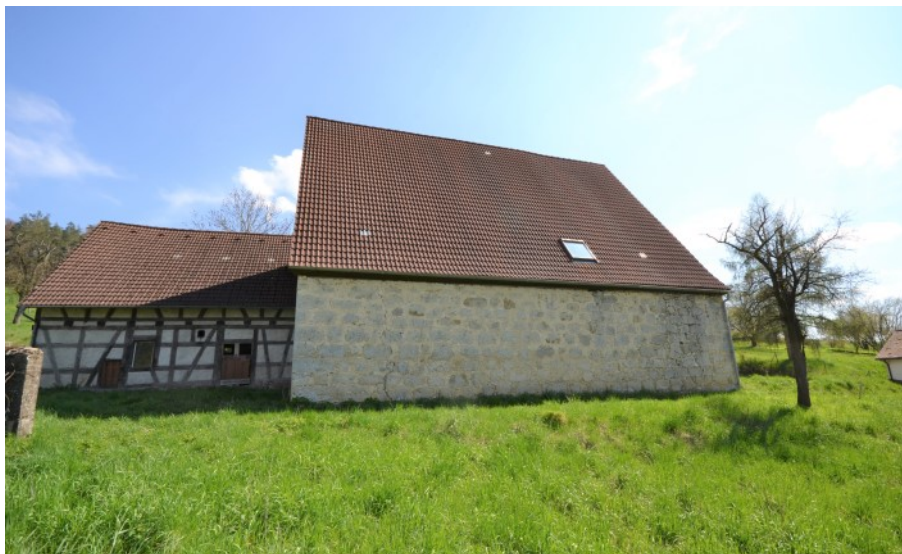
Großzügiger Massivbau mit kleinem Fachwerk-anbau