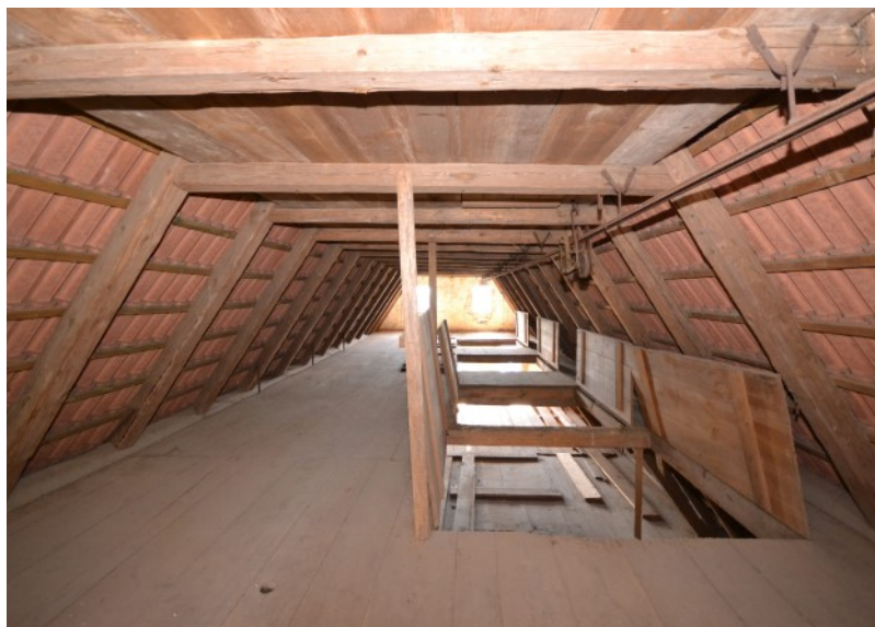
Viel Platz auf der 2. DG-Ebene