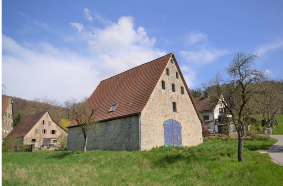
Mächtiger Steinstadel in reizvoller Lage