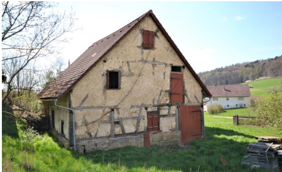
Giebelseite des Fachwerkanbaus