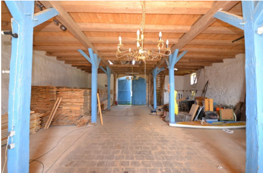
Äußerst eindrucksvoller Eingangsbereich