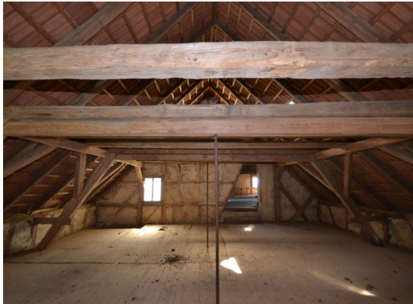
Raum für Ihre Nutzungsideen