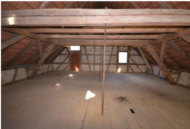
Vielseitig nutzbare Räumlichkeiten