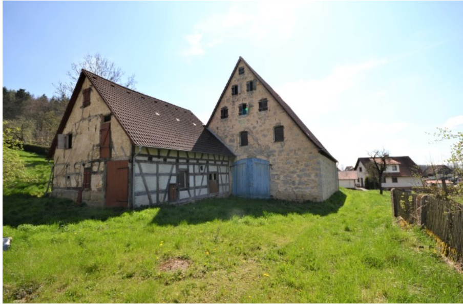
Attraktives Gebäudeduo nahe Nürnberg