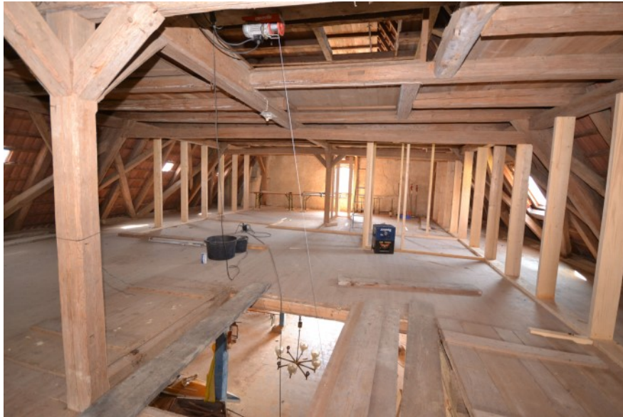
Beachtliche Fläche im Dachbereich