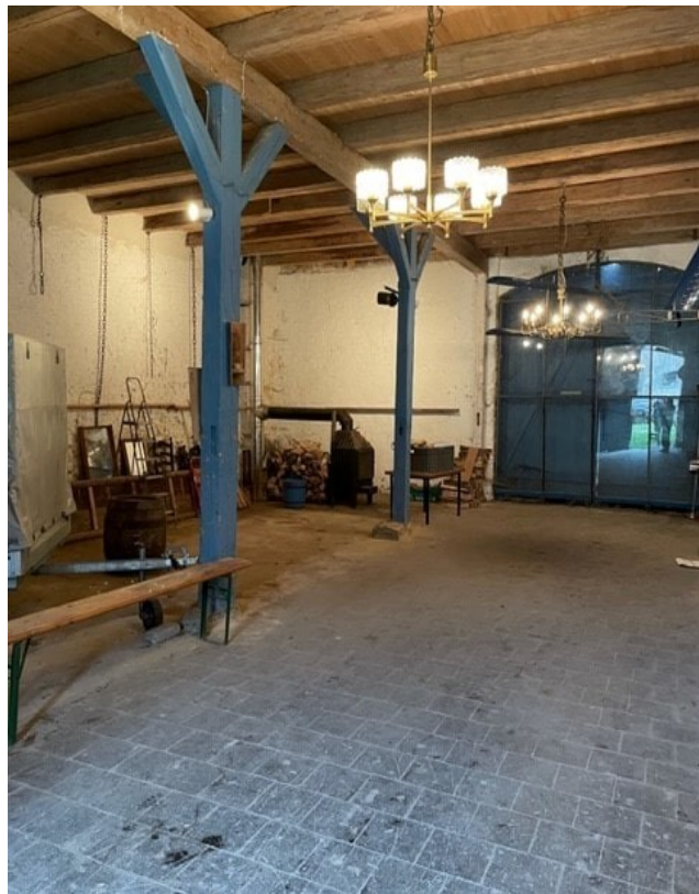
Großzügige Nutzfläche im Erdgeschoss