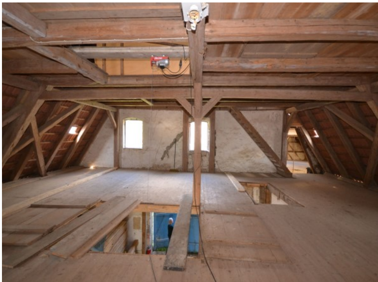
Kreativ gestaltbarer Dachbereich