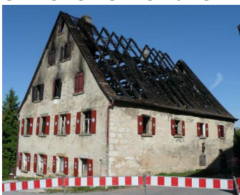
Abb. 1,3: Thomas Wenderoth

Online-Teilnehmer zahlen 100 € (ermäßigt 50 €).