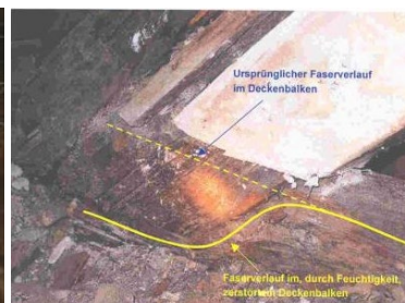
Abb.3: Walter Schwarz