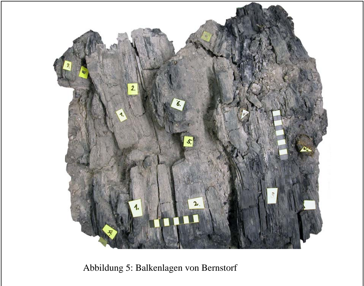
Abbildung 5: Balkenlagen von Bernstorf