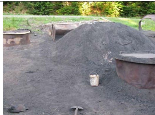
Abbildung 4: im Umkreis eines Kohlmeilers fallen große Mengen Holzkohlen an