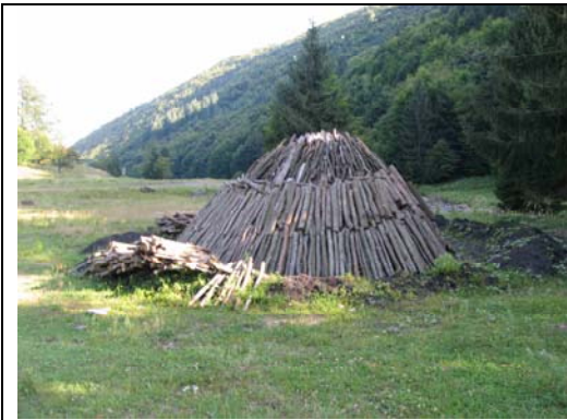
Abbildung 3: Holzkohlemeiler