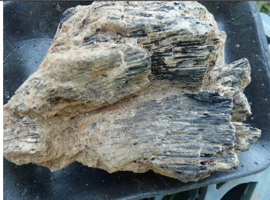
Abbildung 2: Verkohlte Eichenbrettfragmente aus Targu Lapus