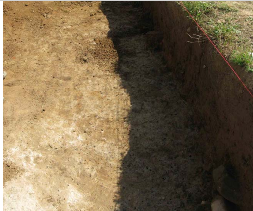
Abbildung 1: kleine (auf Bild kaum erkennbar) Holzkohlefitter verteilt auf Fläche

Flecken auftretende Holzkohlen, die mehr oder weniger dicht in der Schicht verteilt liegen. Bei dichterem Auftreten stellen sie sich als schwarzfleckige Schichten dar. Dabei handelt es sich um verschlepptes Material von Herdfeuern, Bränden u. a. Dieses Material besitzt meistens einen heterogenen Artenquerschnitt und repräsentiert die Holznutzung einer Siedlung am besten. Nachteilig ist die meistens schlechte Qualität. Für dendrochronologische Untersuchungen ist das Material ungeeignet. Um statistisch relevante Mengen (mindestens 20) zu erhalten, müssen größere Flächen der zu untersuchenden Schicht abgesammelt werden.